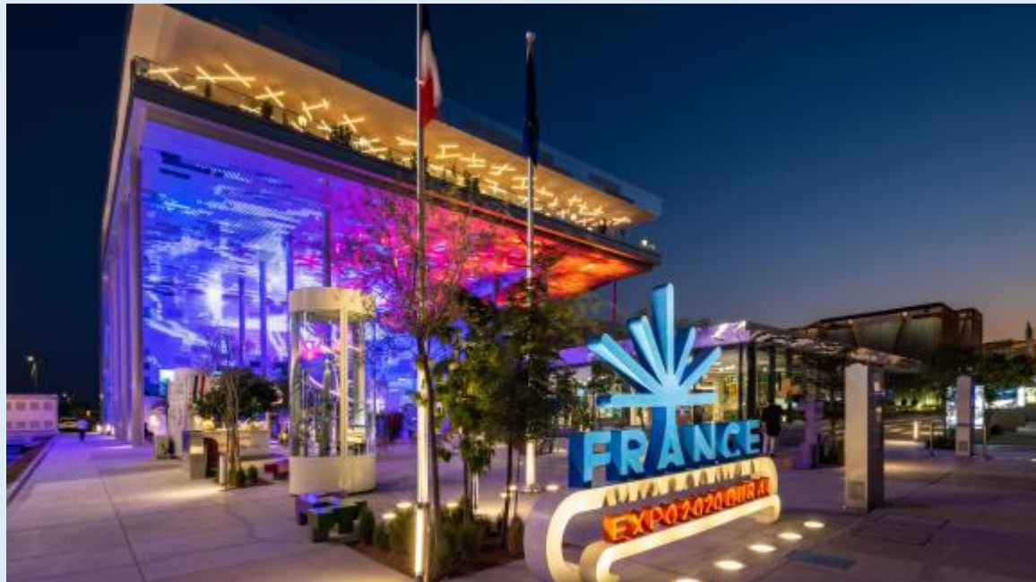
Le Pavillon France à l'Exposition universelle

L'exposition universelle se déroule du 1 er octobre au 31 mars aux Emirats arabes unis avec pour thème principal : « Connecter les esprits, Construire le futur »